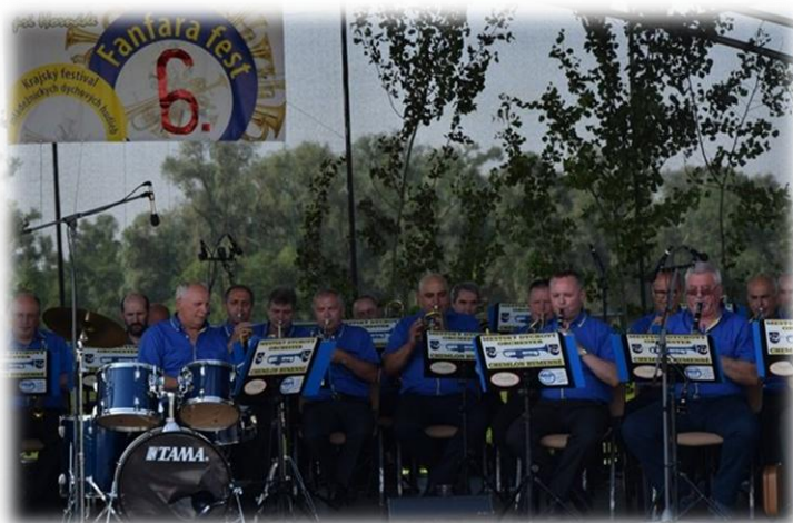
FANFARAFEST 09.06.2019 – TRSTENNÉ PRI HORNÁDE