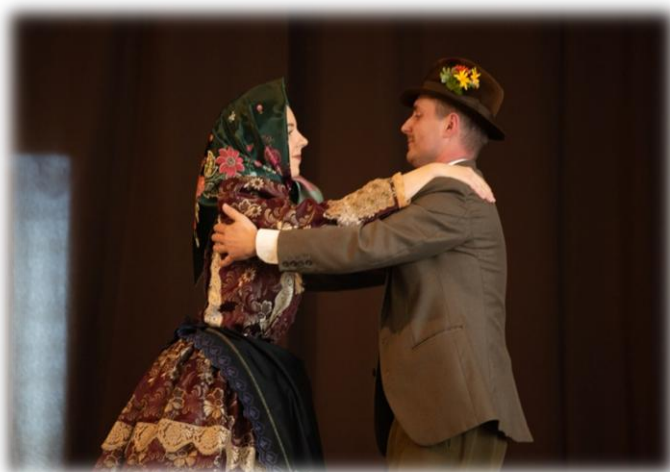
ŠAFFOVA OSTROHA 31.03.2019 KD BIDOVICE