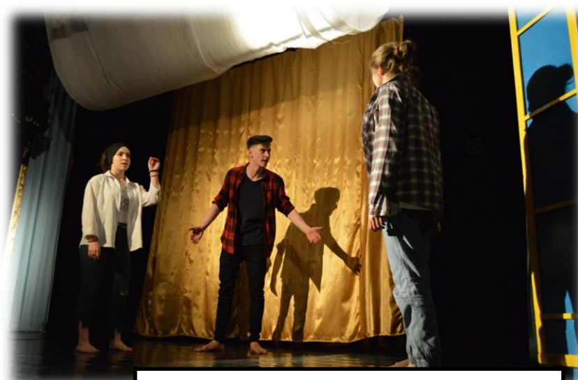
DETSKÉ DIVADELNÉ KOŠICE 11.4.-12.4.2019 – CVČ DOMINO, KOŠICE