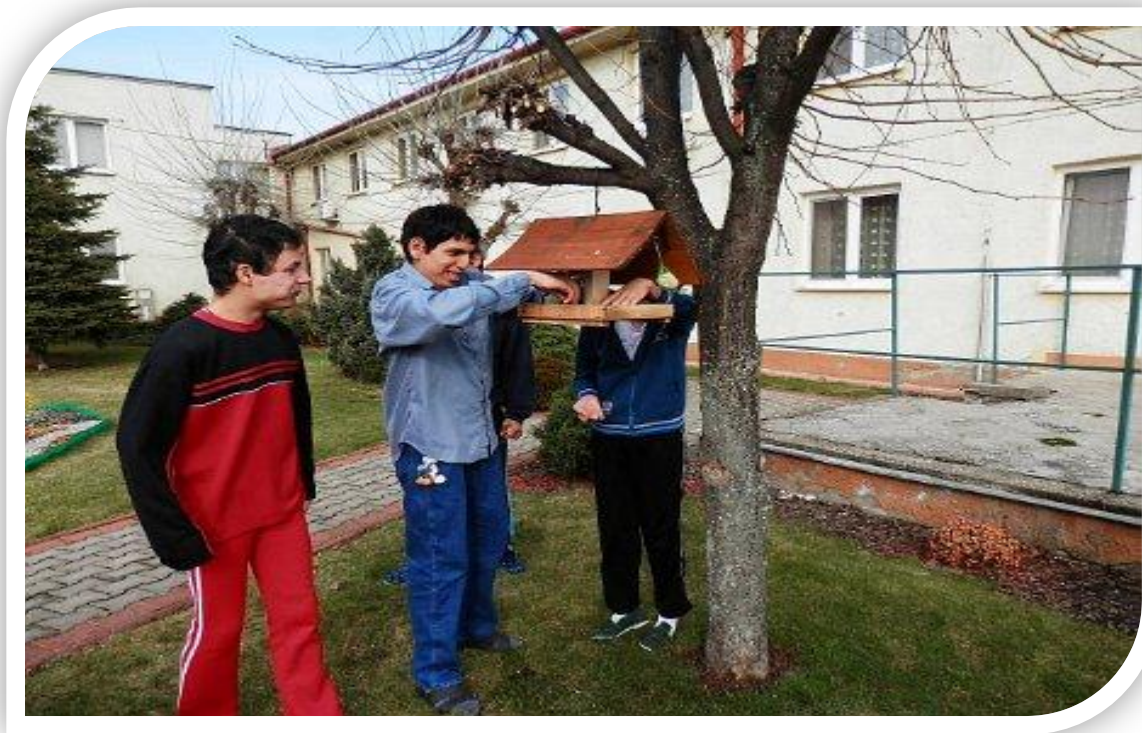
Kŕmenie vtáčikov 1