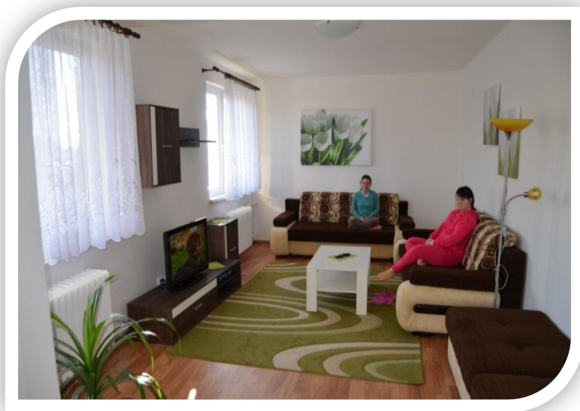
Tréningové bývanie 1